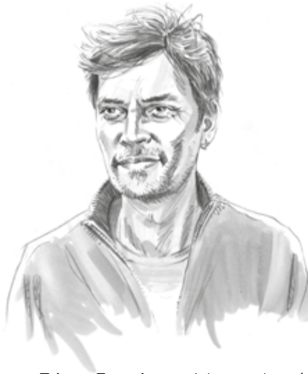
par Tristan Fournier, sociologue, chargé de recherche au CNRS (Iris, Paris)

Prendre soin de sa santé et protéger l'environnement apparaissent désormais comme des dimensions structurantes de notre rapport à l'alimentation : les industriels surfent allègrement sur la vague verte, des applications mobiles permettent de débusquer les aliments « trop gras » ou « trop transformés », les compléments alimentaires se vendent comme des petits pains et le véganisme a fait son entrée dans le dictionnaire. Mais quels rôles l'État peut-il et doit-il jouer à l'égard de ce qu'il convient d'appeler la transition alimentaire ?