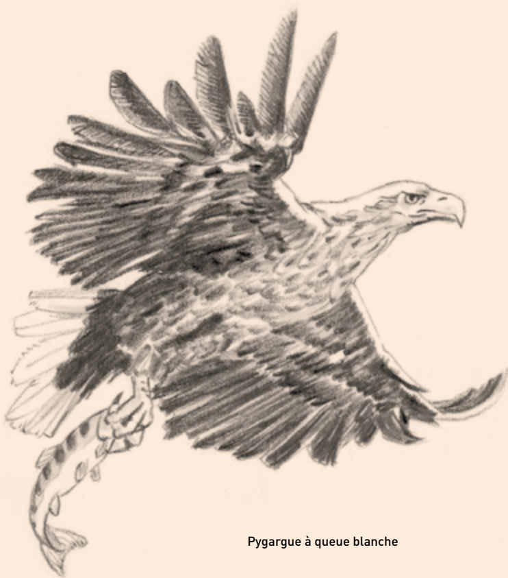
Pygargue à queue blanche

à queue blanche... Nul doute que d'autres surprises nous attendent comme l'installation du phoque veau-marin, de l'aigle pomarin, de l'esturgeon atlantique, voire de l'élan (Lecomte, 1998)!