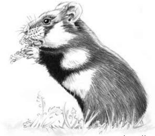
Le grand hamster