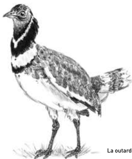
La outarde canepetière